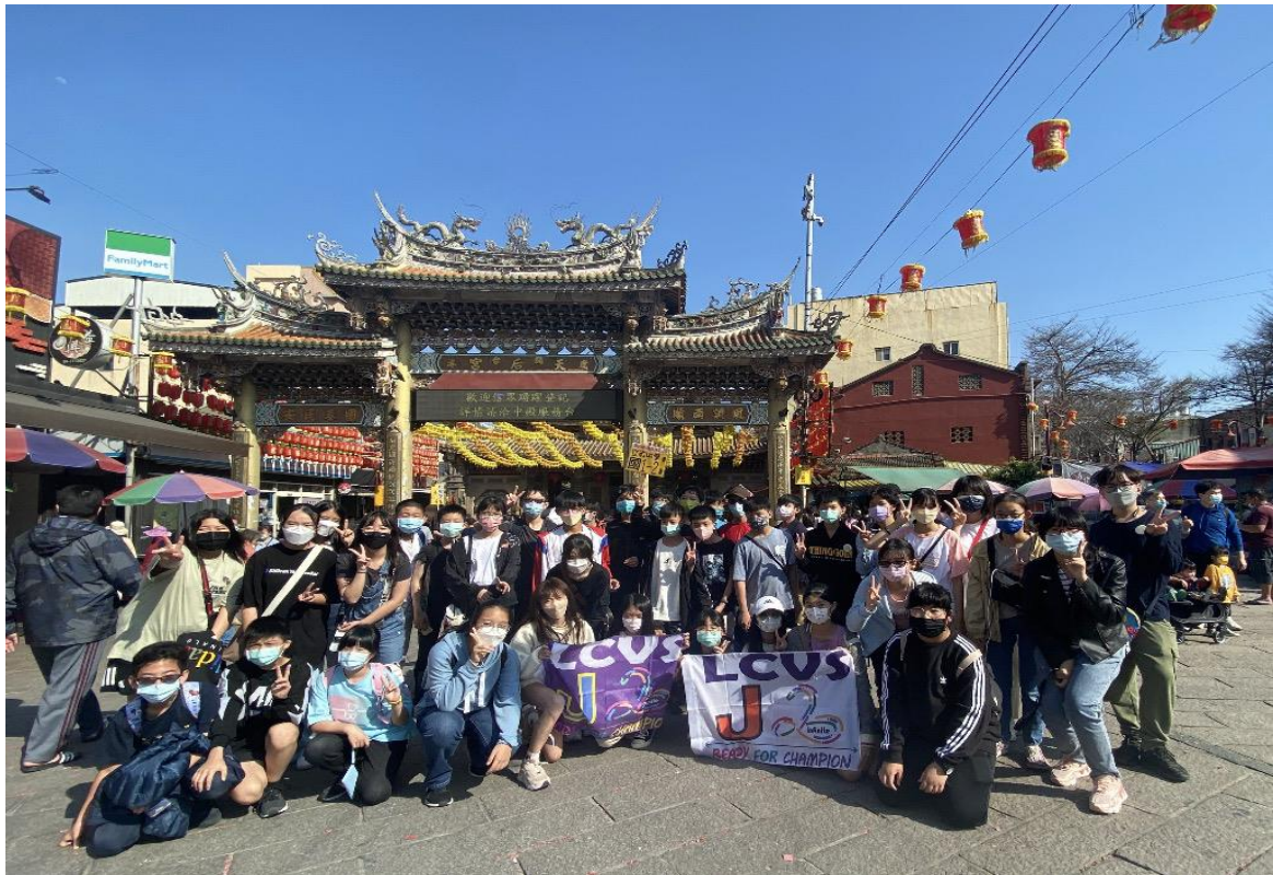
本土景點教學活動—探究宗教文化