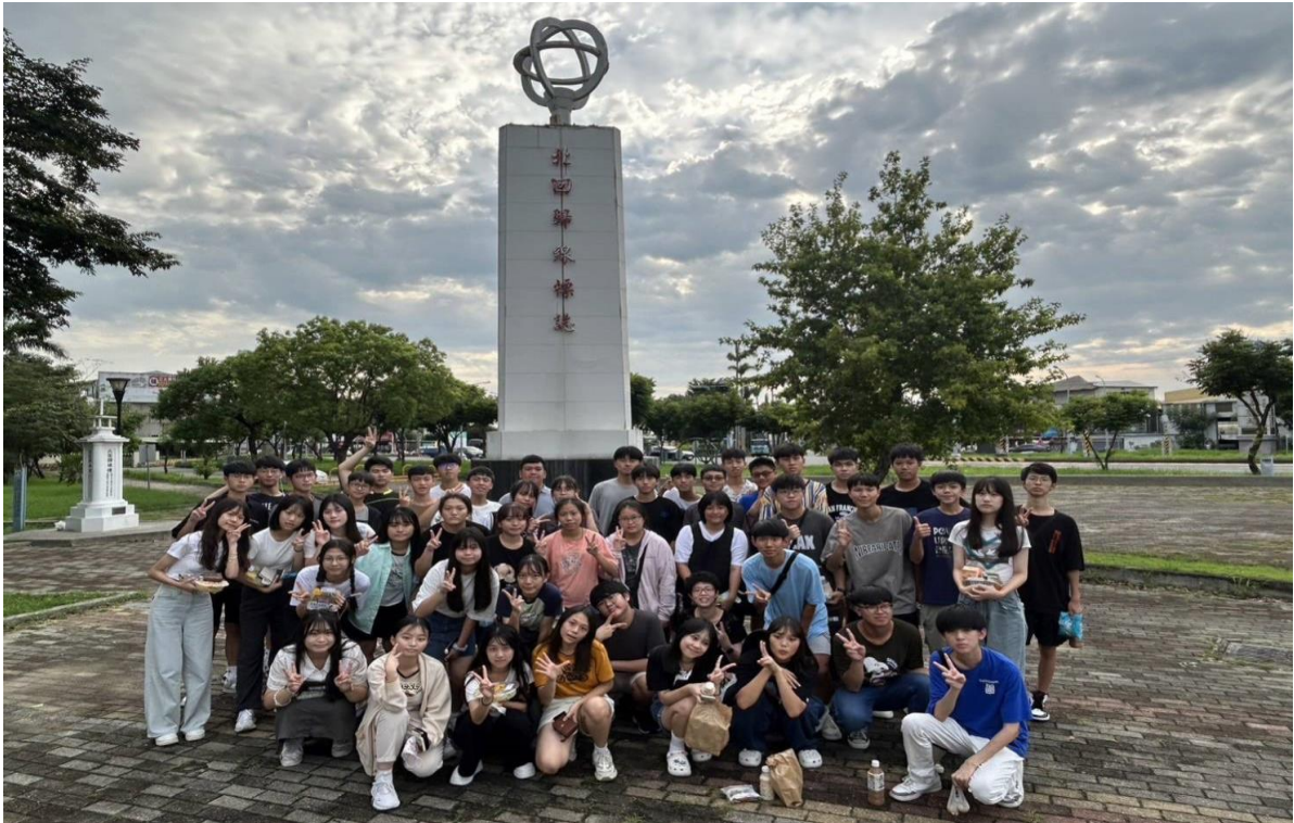
北回歸線踏查—學生家長同行探尋本土歷史、文化與美學